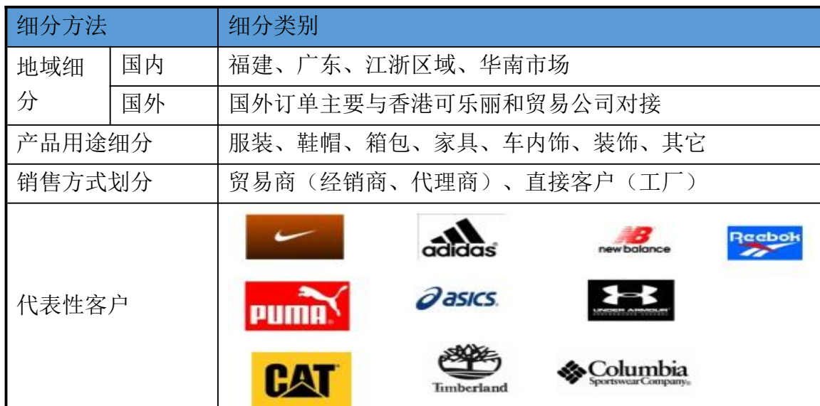
表 1 顾客群、细分市场综合分类

公司主营业务为合成革产品的研发、生产和销售，应用范围较广，包括家具、鞋材、箱包、车用、服装及包装等。基于合成革的行业特性，内销市场主要以福建、广东及江浙区域为主，外销市场主要与香港可乐丽和贸易公司对接。对顾客群和市场细分主要按区域、产品用途、销售方式和顾客等级等进行划分。